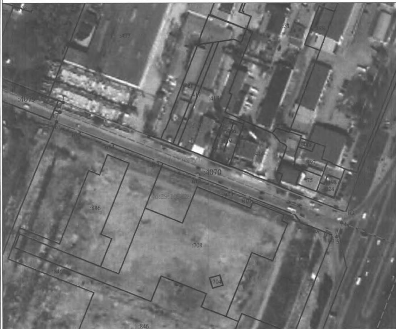
Схема границ публичного сервитута