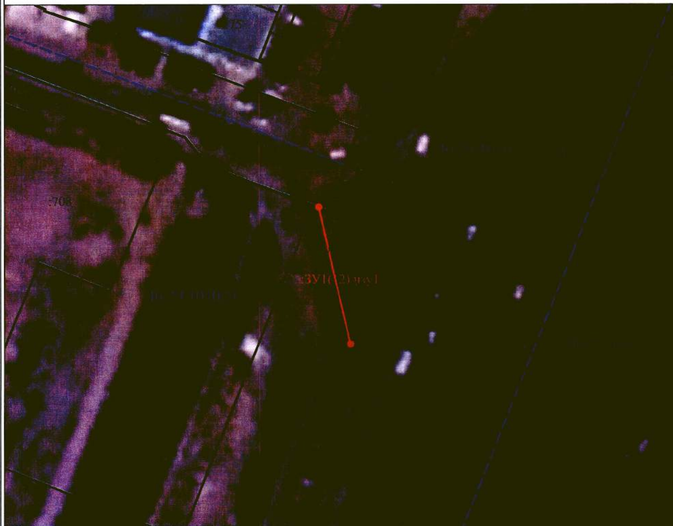
Схема границ публичного сервитута