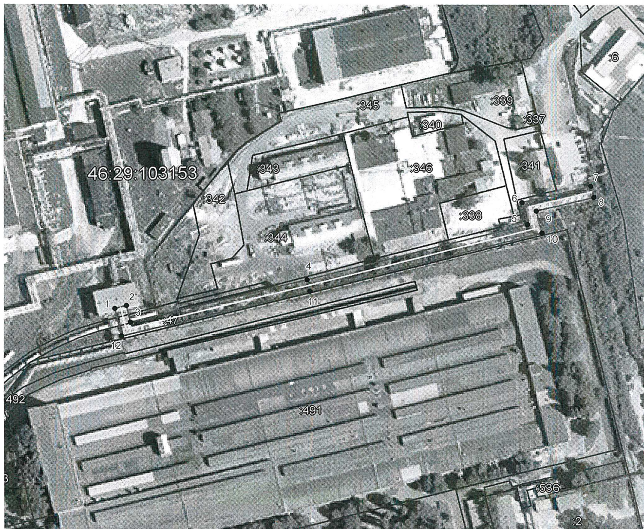
Схема границ публичного сервитута

ПРИЛОЖЕНИЕ 2 УТВЕРЖДЕНА постановлением Администрации города Курска от « 24 » сентября 2025 года № 29