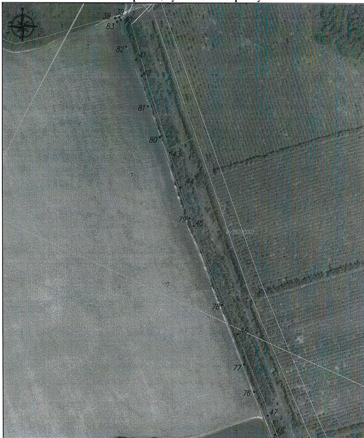
Схема границ публичного сервитута