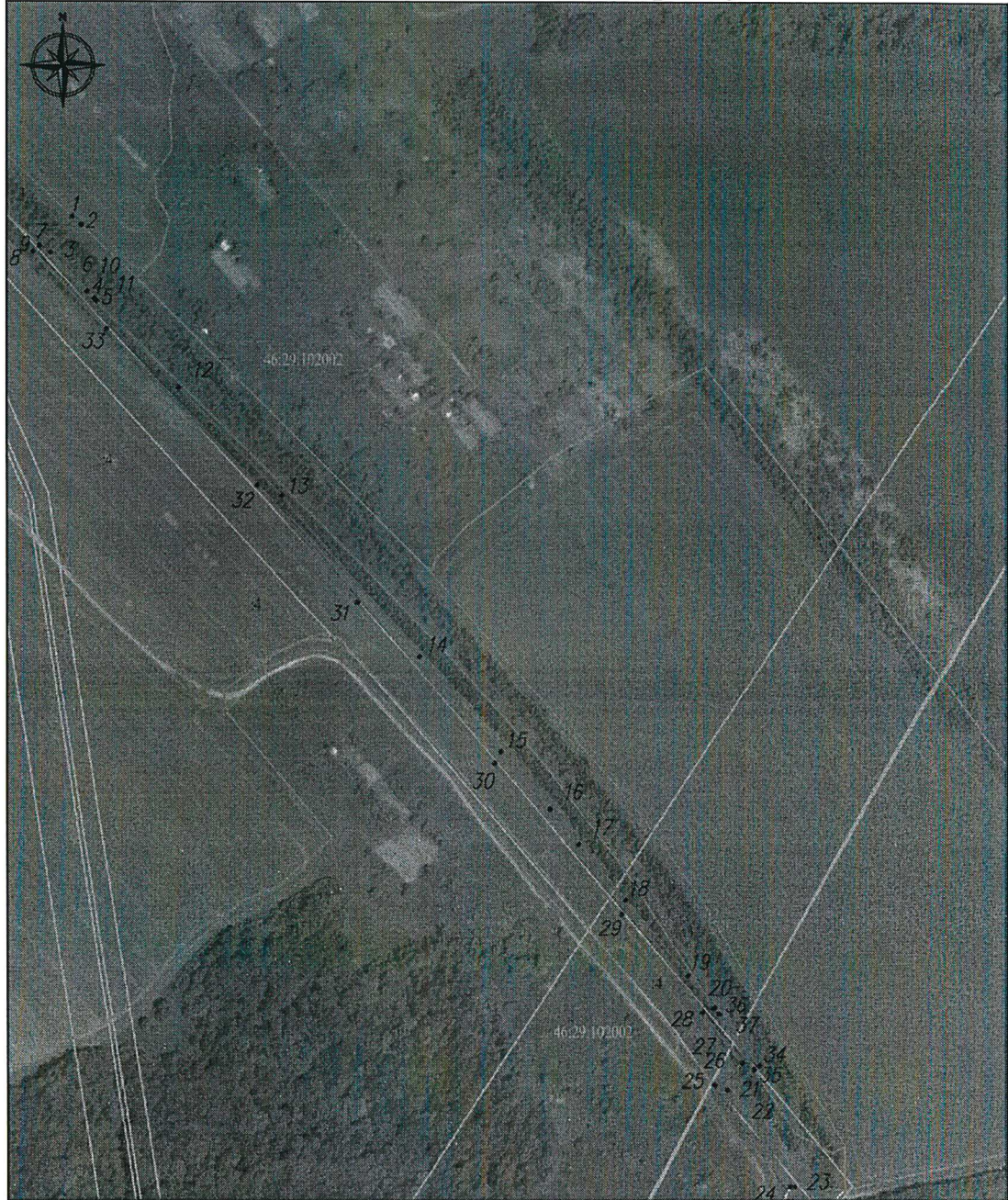
Схема границ публичного сервитута