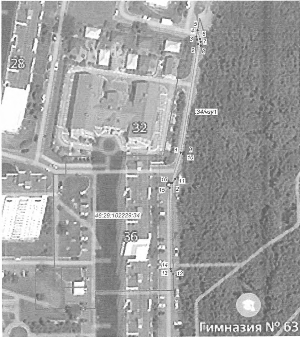
Схема границ публичного сервитута

ПРИЛОЖЕНИЕ 2 к постановлению Администрации города Курска от "25" октября 2023 года № 604